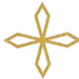
Quatre Directions Quatre Générations Quatre Couleurs