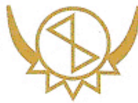
Bouclier de buffle