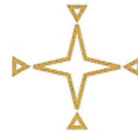
L'étoile du matin